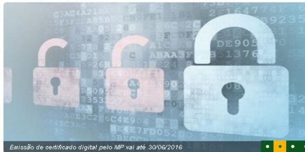
Emissão de certificado digital pelo MP vai até 30/06/2016